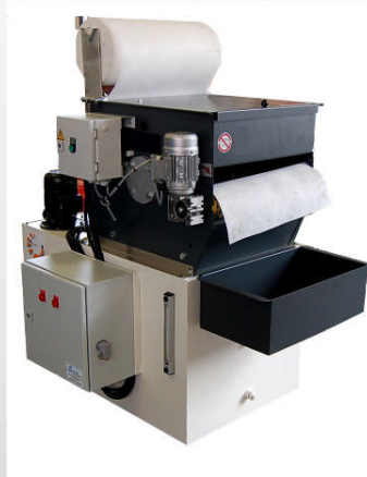
Bac de filtration d'huile pour tour CN avec filtre papier 50 \mu m et pompe HP 18 bars.