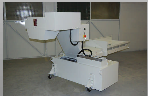
Convoyeur d'extraction de copeaux inox pour tour CN Tornos Sigma 20