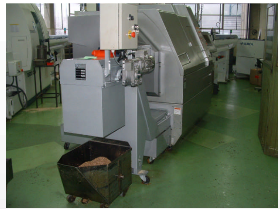
Convoyeur d'extraction de copeaux laiton pour tour CN Citizen M32