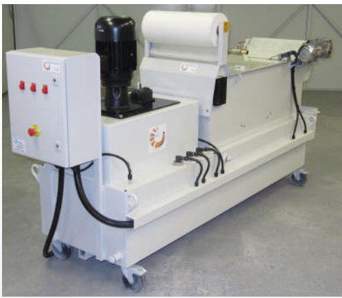
Bac de filtration d'huile pour tour CN avec filtre papier 50 \mu m et pompe HP 70 bars, volume 450 litres.