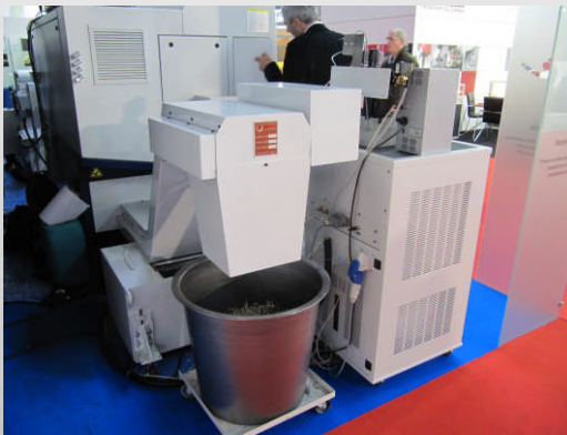
Convoyeur d'extraction de copeaux laiton pour tour CN Tornos Sigma 32