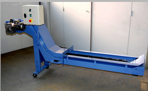
Convoyeur d'extraction de copeaux aluminium pour tour CN Star SV32JII