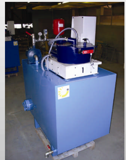
Cuve de stockage d'huile avec filtre centrifuge 10 \mu m, 70 l/min